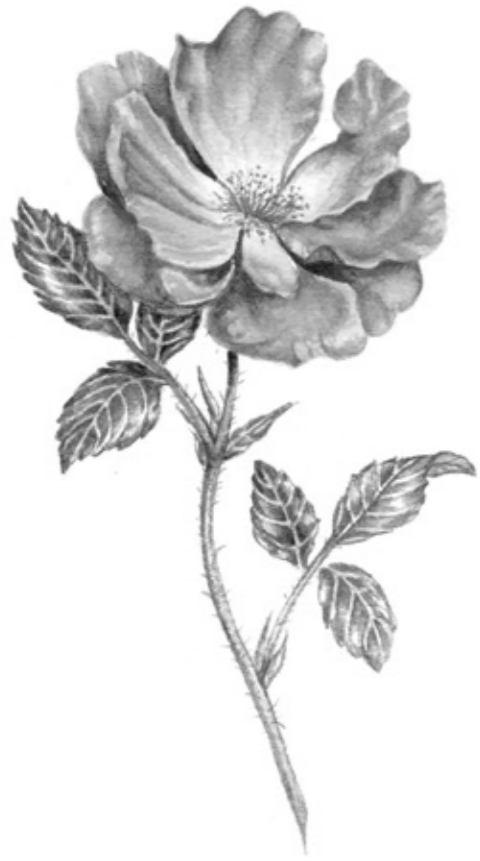
Colar Rosa Colar em ouro, diamante, rubi e rosa em marchetaria