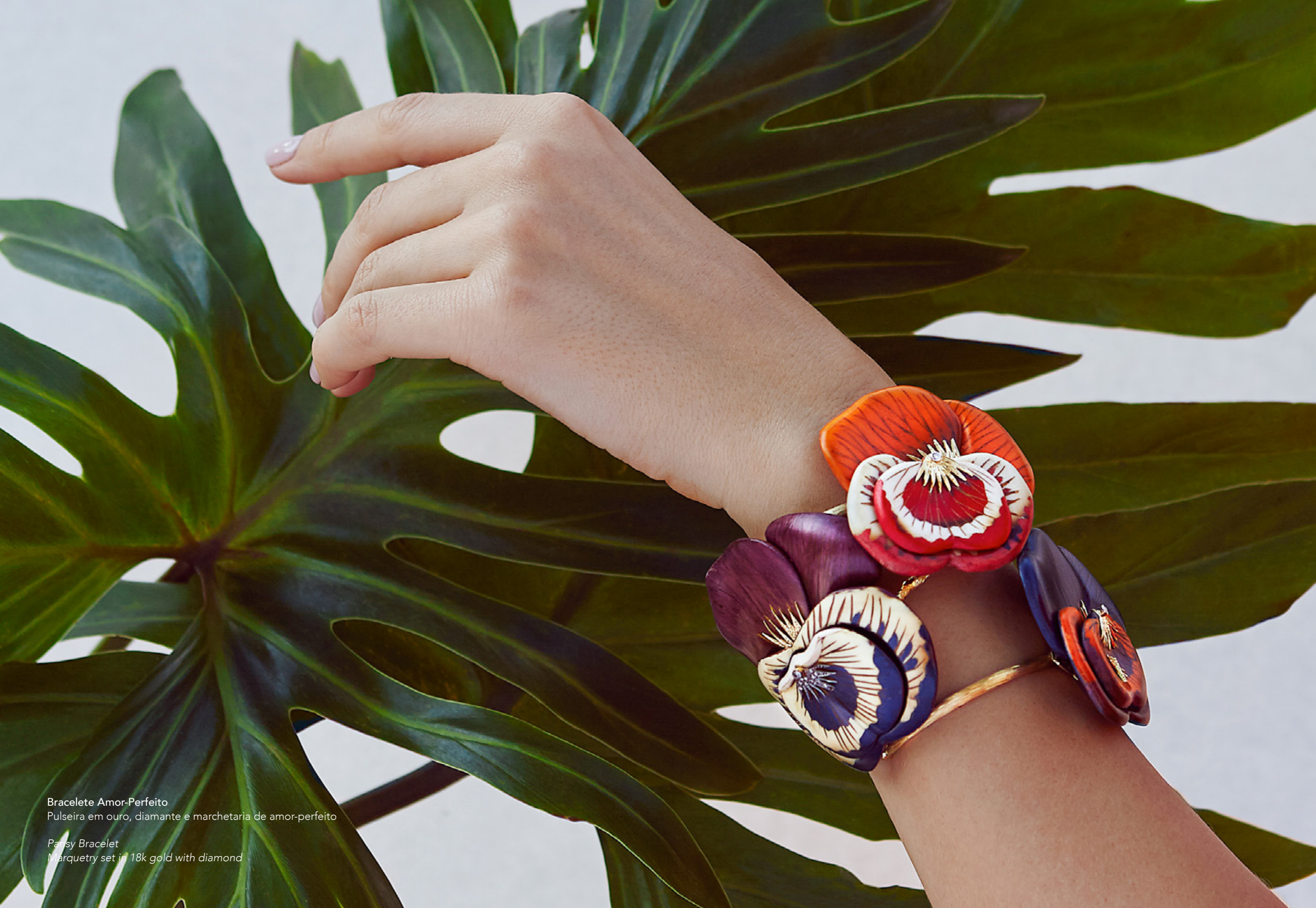
Bracelete Amor-Perfeito Pulseira em ouro, diamante e marchetaria de amor-perfeito