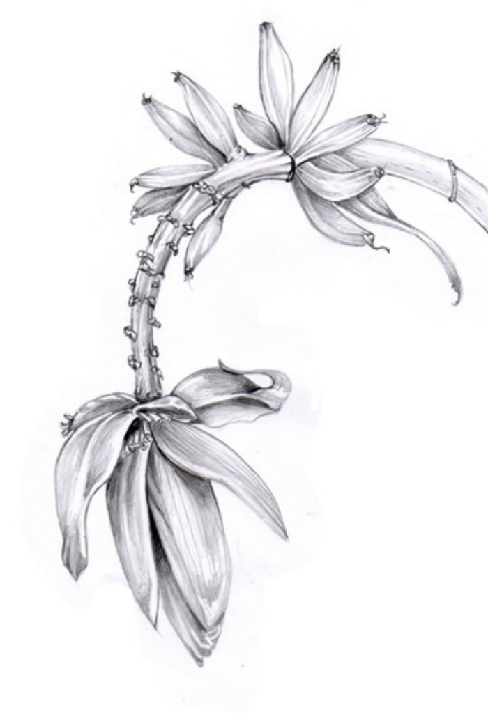
Brincos Bananeira Brincos em ouro rosa, diamante, rubi, ametista e marchetaria em coração de bananeira