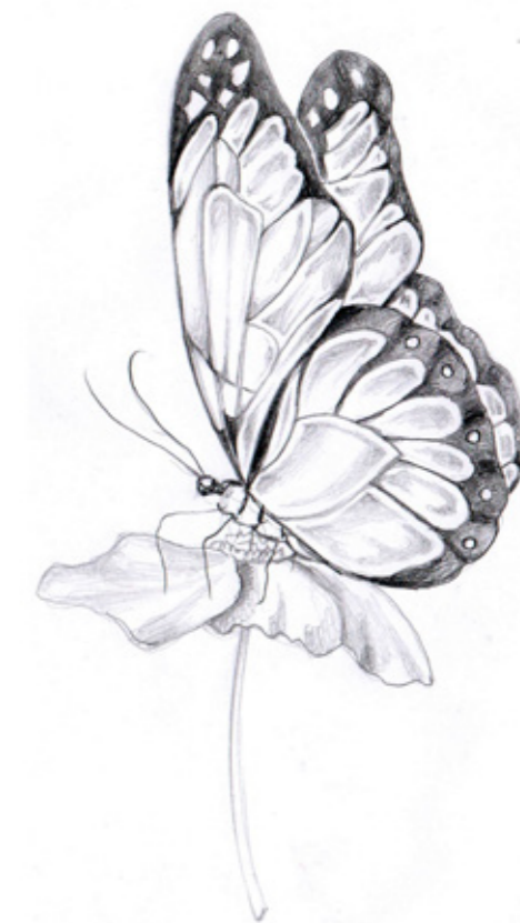
Broche de Borboleta Broche em ouro, diamante, rubi, safira amarela e marchetaria de borbolet